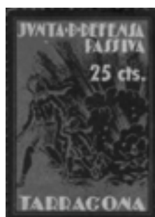
Segell de la Junta de Defensa Passiva de Tarragona.