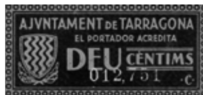
Paper moneda editats per l'Ajuntament de Tarragona.