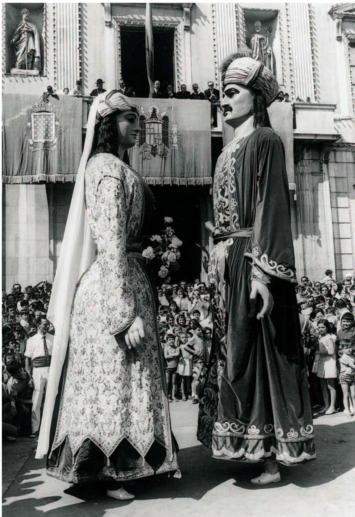
Ball de Gegants davant l'Ajuntament de Tarragona, dia de Santa Tecla de 1963.