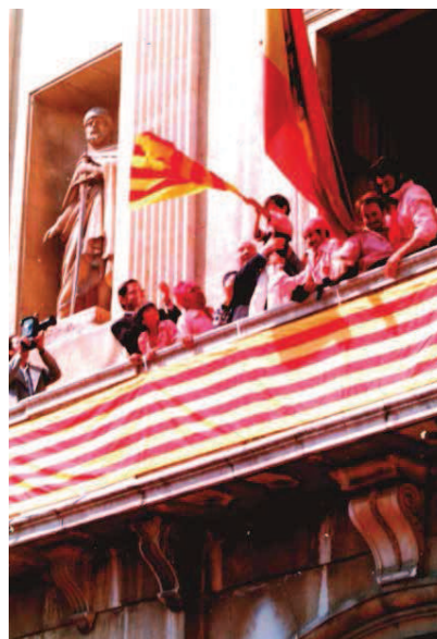
El president Josep Tarradellas, sostenint l'anxaneta de la Colla Xiquets de Tarragona al balcó de l'Ajuntament de Tarragona, el 23 de setembre de 1978.

Text: JORDI PIQUÉ PADRÓ | Historiador i arxivista