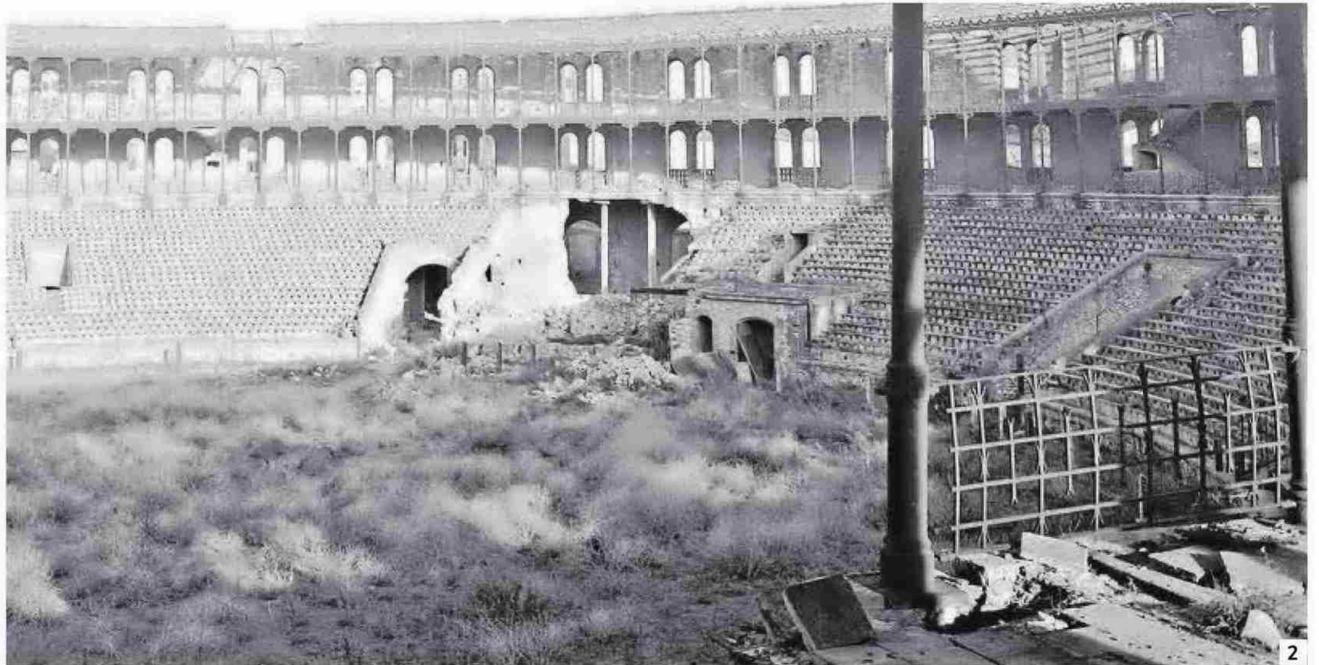
1. Manifestación en la Rambla, 8/3/1937. FOTO: (AHCT) 2. Plaza de toros tras los bombardeos, 11/8/1937. FOTO: (AHCT) 3. Grupo de niños tarraconenses volviendo de las colonias de verano, 19/7/1936. FOTO: (AHCT)