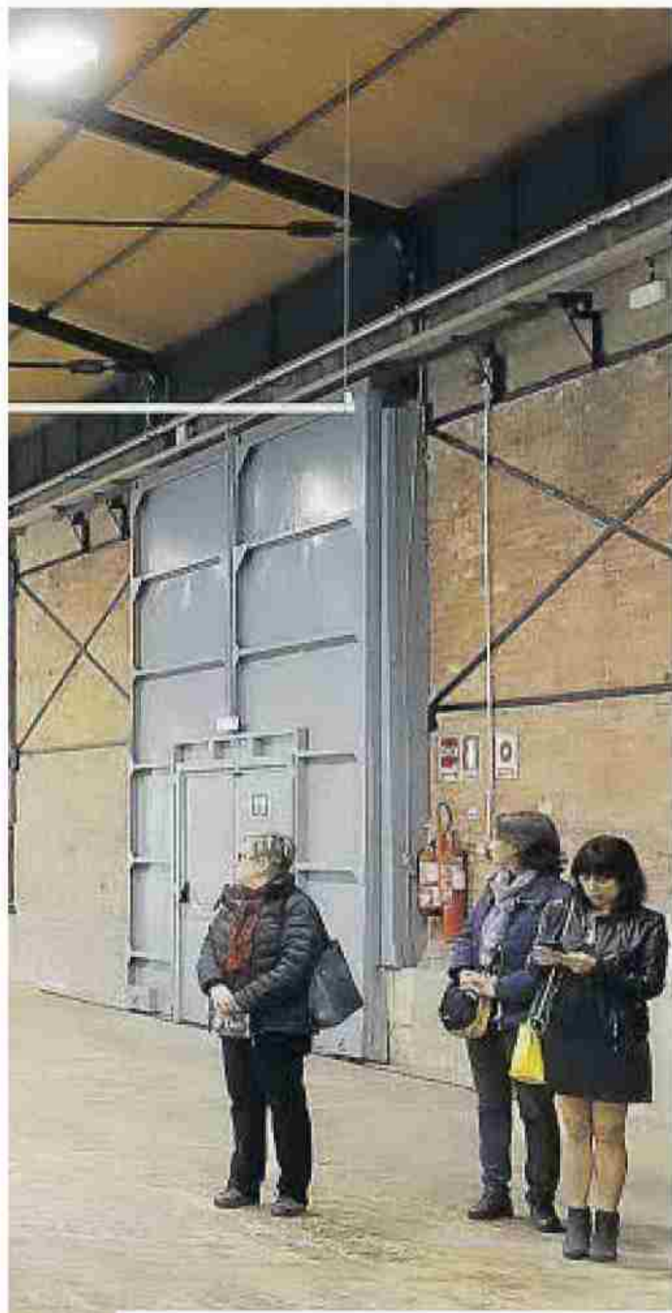
Ayer se inauguró la exposición en el Tinglado 2 del Moll de Costa de Tarragona.